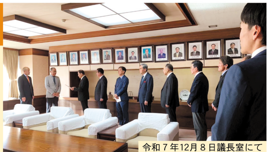
令和7年12月8日議長室にて

私が所属する市議会最大会派政友クラブは、議員本人が説明責任を果たすべきだとする申し入れ書を議長に提出しました。